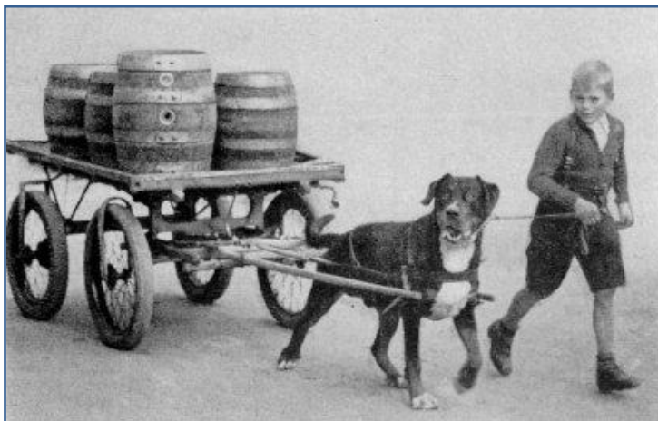
Calado del perro con el carro

La violación a esta normativa es considerada una ofensa criminal y es penada con sentencia de prisión hasta 3 años, y una multa de 16.750 euros.