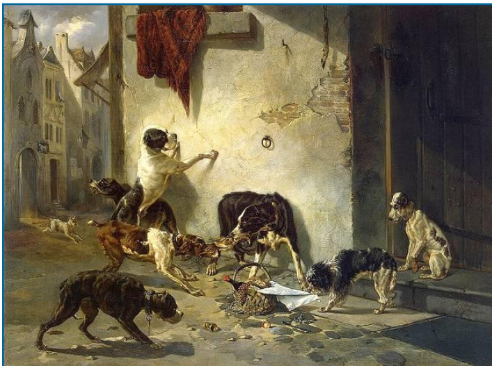
Pintura de Joseph Stevens del año 1846

Para los años 1800 casi todos los hogares holandeses tenían perros, lo cual era la causa de que existiesen muchos perros en las calles. Existen varias pinturas del período que ilustran este hecho.